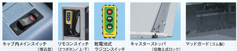
キャブ内メインスイッチ (埋込型) リモコンスイッチ (2つボタン/上・下) 乾電池式 ラジコンスイッチ キャスターストップ (切換え式ロック) マッドガード(ゴム製)